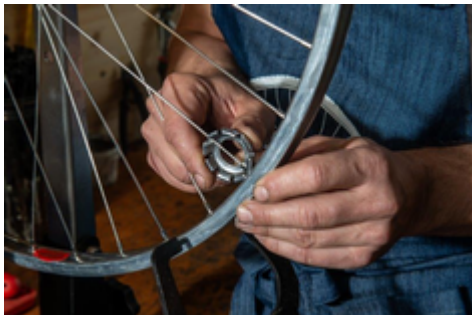
Illustration 1

Direction de l'information légale et administrative (Premier ministre)